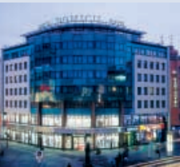
Hotel D.O.M.I.C.I.L. Berlin

Es sind nur wenige Schritte zum Kurfürstendamm, zum Zoologischen Garten und zur Kaiser-Wilhelm-Gedächtniskirche sowie wenige Autominuten zu Berlins hochkarätigen Sehenswürdigkeiten: Brandenburger Tor, Siegessäule, Reichstag.