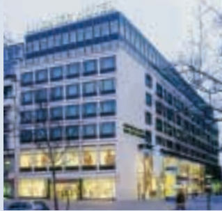
LINDNER HOTEL AM KU'DAMM