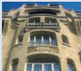
Paris Marriott Hotel Champs-Élysées

Nahe dem bekannten Grand Place und dem gotischen Rathaus liegt das 5-Sterne-Hotel umgeben von kleinen Gässchen mitten im Zentrum Brüssels. Das Hotel verfügt über 281 luxuriöse Zimmer inklusive 23 individueller Suiten.