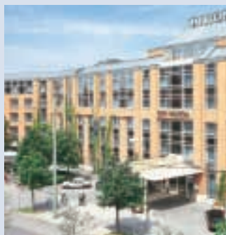
Hilton Munich City

In wenigen Gehminuten erreichen Sie das Deutsche Museum und den Marienplatz – ein ausgezeichnete Startpunkt zur Erkundung der bayerischen Hauptstadt. Oder erleben Sie im nahe liegenden Kulturzentrum „Gasteig“ einen Konzertabend mit der weltbekannten Münchner Philharmonie und anderen berühmten Interpreten.