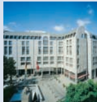
Hamburg Marriott Hotel

Ob Sie Hamburg geschäftlich oder zum Vergnügen besuchen, das Hamburg Marriott Hotel heißt Sie herzlich willkommen. Genießen Sie den Service und den Komfort eines Marriott First-Class-Hotels im Herzen der Stadt. Jedes der komfortablen 277 Zimmern strahlt in hellen, freundlichen Farben. Die charmante Lobby und ausgezeichnete Service verleiten den anspruchsvollen Hotelgast zu einem längeren Aufenthalt.