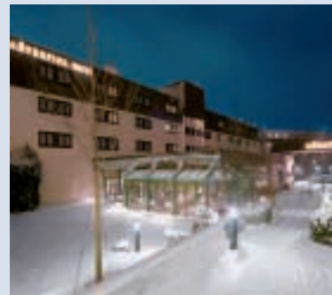
Mövenpick Hotel Stuttgart Airport

Das Mercure City Center befindet sich mitten in Stuttgart. Alle 174 Gästezimmer bieten hohen Komfort und sind dem hohen Standard der Mercure Hotels entsprechend ausgestattet. Im Restaurant und im Bistro mit regionaler Küche verwöhnt eine vielfältige Gastronomie.