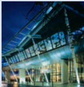
Radisson SAS Manchester Airport