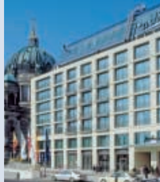
Radisson SAS Hotel

In Berlin pulsiert das Leben. Nicht umsonst hat so mancher noch einen Koffer in der Hauptstadt. Die meisten davon stehen vermutlich in einem unserer Highlights, beispielsweise im InterConti, im Dorint Schweizerhof, im LINDNER AM KU'DAMM, im Hotel D.O.M.I.C.I.L. – oder in unserem neuesten Highlight dem Radisson SAS im CityQuartier DomAquaree.