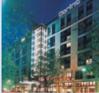
Hotel Schweizerhof Dorint Sofitel