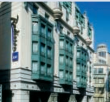
Radisson SAS Hotel Brüssel