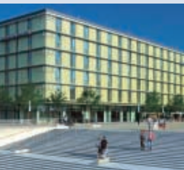
Dorint Novotel München Messe

Verkehrstechnisch hervorragend gelegen, ist das StadtQuartier Riem Arcaden in der Messestadt – Münchens größtes Bauprojekt. Das Dorint Novotel München Messe liegt direkt am ehemaligen Flughafen München Riem und verfügt über 250 elegant ausgestattete Zimmer und ein Restaurant für gehobene Ansprüche. Über den Messebahnhof West, der nur 100 Meter vom Hotel entfernt ist, kann die Münchner Innenstadt bequem und schnell erreicht werden.